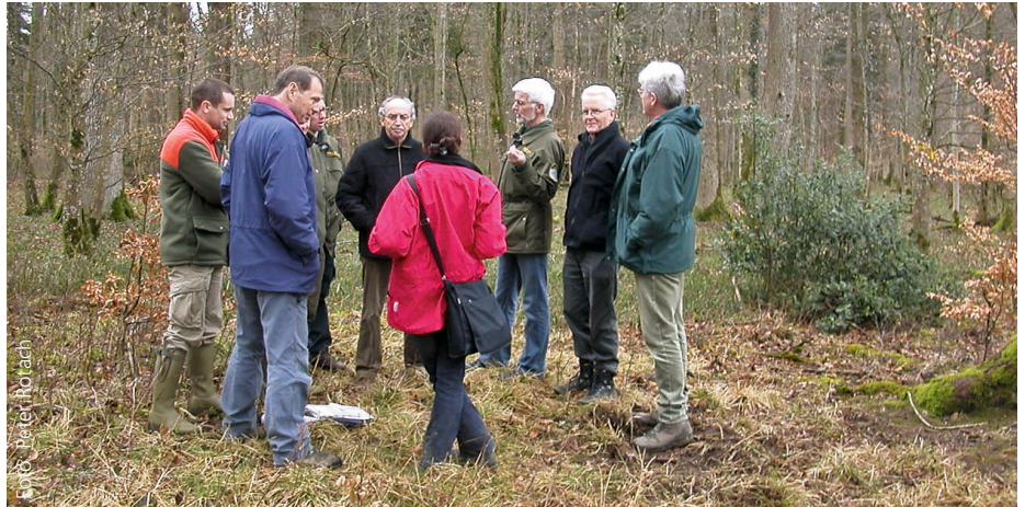
Schulung der Forstingenieure des Kantons Thurgau in den Marteloskopen Tägerwilen.

Die Auswahl der zu erhaltenden Eichen im Sinne einer langfristigen und nachhaltigen Bewirtschaftung kann nicht nach einem starren Schema erfolgen. Es muss genau überlegt werden, wie die gesteckten Ziele am Besten erreicht werden können. Bei der Auswahl scheint eine Kombination aus ökologisch sehr wertvollen Eichen und Eichen mit tiefen ökonomischen Werten eine realistische Lösung zu sein, damit beiden Seiten Rechnung getragen werden kann. Zusätzlich ist es wichtig, Faktoren wie die räumliche Ver-