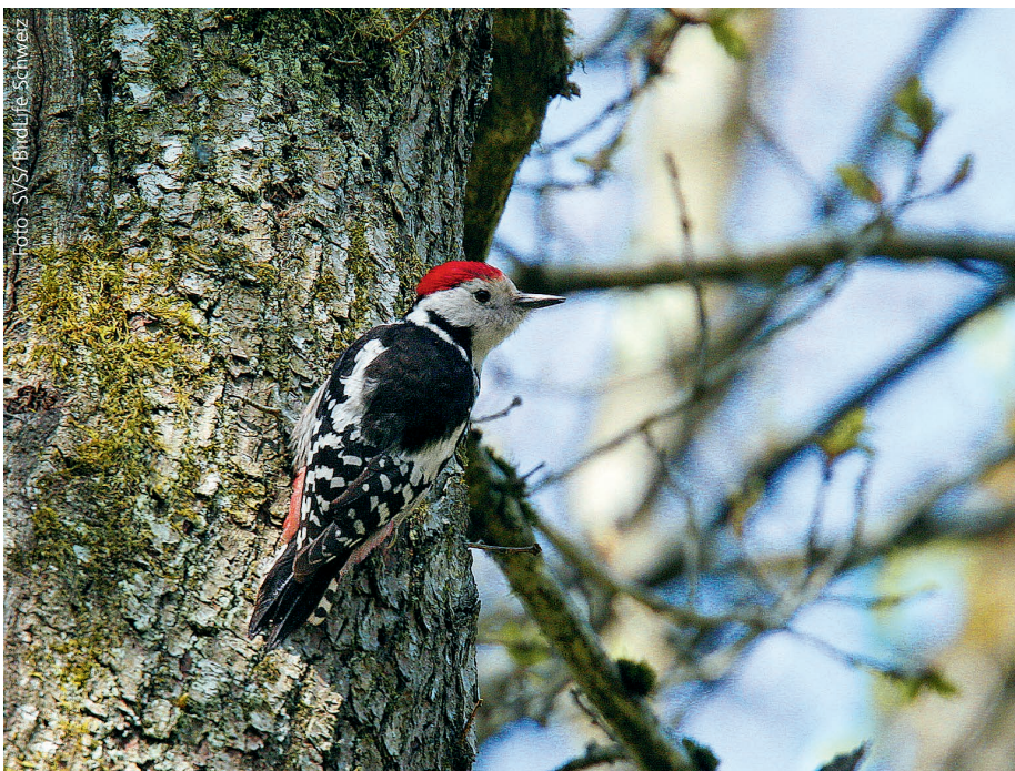
Der Mittelspecht liebt strukturreiche Eichenwälder.

Nussbaumer, H. (2008): Eichen-Förderung im Kanton Thurgau – Erhaltung und Erhöhung des Eichenanteils. Forstamt Kanton Thurgau. 12 p.