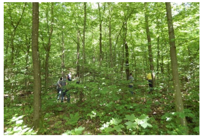
Abb. 6: Bei entsprechender Pflege zeitigt auch Naturverjüngung sehr gute Resultate!