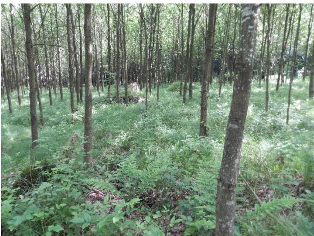
Abb. 2: Bornwald. 16-jähriges Stangenholz aus Stieleiche: sehr gute Qualität!