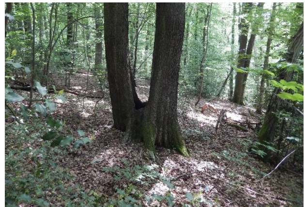
Abb. 4: Bannwald. Stockausschläge begründen den 200-jährigen Eichenbestand.