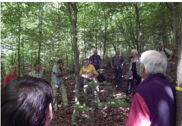
Abb. 5: Künstliche Verjüngung. Erste Versuche mit Trupp-Pflanzungen.